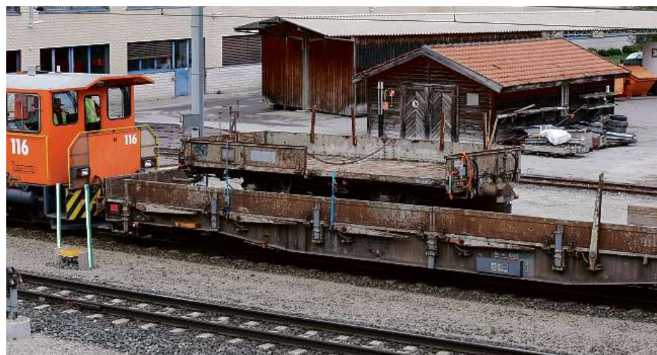
Gerettet: In Chur ist der historisch wertvolle Güterwagen M 7070 entdeckt und später zur Restaurierung abtransportiert worden.